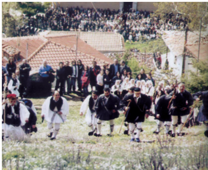
Ανηφορικός Δρόμος γερόντων, προς ανά- μνηση της Μάχης της Αράχωβας, απέναντι από την εκκλησία του Αγίου Γεωργίου.

→ Ο Αρχιστράτηγος με την υπόλοιπη δύναμη και τους Αραχωβίτες των άλλων συνοικιών κατείχαν το κέντρο της διατάξεως στην εκκλησία του Αγίου Γεωργίου και στα γύρω σπίτια.