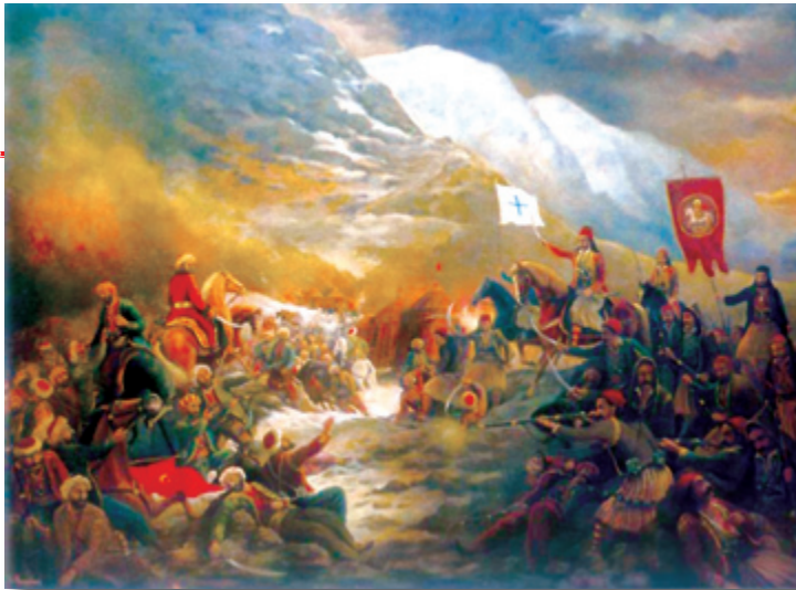
Η Μάχη της Αράχωβας, 1826. Έργο του Λαζαρή Φαρμάκη.

Όλα αυτά τα άκουσαν οι πιο πολλοί από τους συγκεντρωμένους, οι οποίοι τα επιδοκίμασαν και με ζωηρή συζήτηση, ομαδοποιημένοι σχολίαζαν τη δύσκολη κατάσταση, η οποία επικρατούσε τις τελευταίες ημέρες.