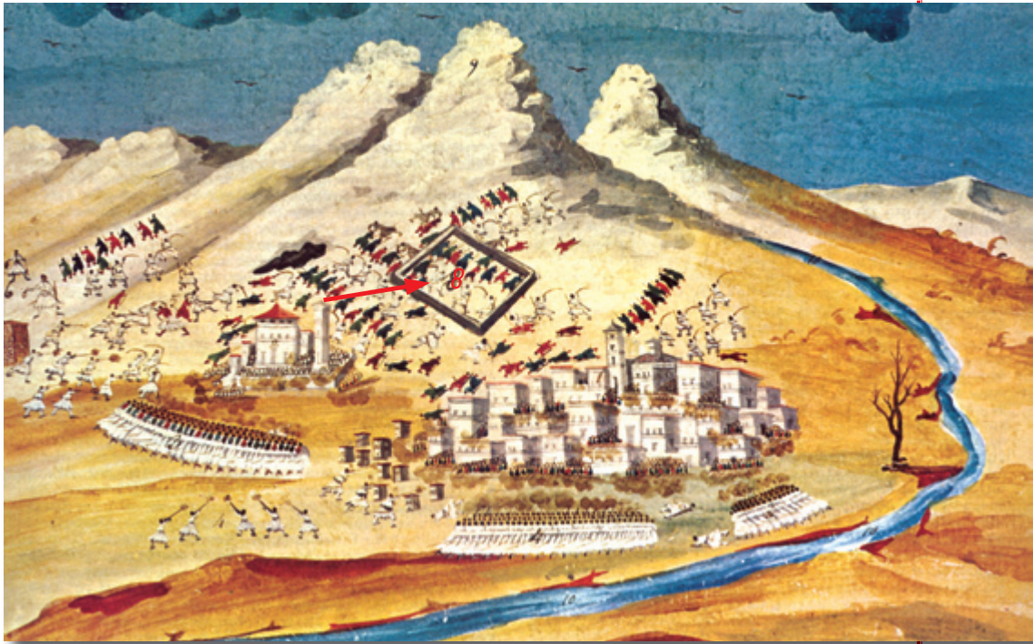
Ο «Πόλεμος των Ελλήνων εις Ράχωβα» των Δ.Ζωγράφου - Ι. Μακρυγιάννη (Αθήναι, Γεννάδειος Βιβλιοθήκη). Με τον αριθμό 8 σημειώνεται στην εικόνα το ταμούρι των Τούρκων.

τμήματος των 500 Τουρκαλβανών δεν ευοδώθηκε, παρά την πεισματώδη προσπάθειά του, με αποτέλεσμα και αυτό να ανατραπεί και να συμπτυχθεί στο εσωτερικό της τοποθεσίας.